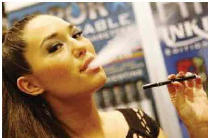
Una modella aspira vapore da una sigaretta elettronica in una immagine pubblicitaria. Tutto è esotico e invitante. Ma la moda sta già finendo, con gravi effetti per i negozi aperti in tutta Italia. Sopra, una vetrina che espone sigarette elettroniche nel centro storico di Genova